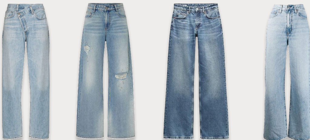
Базовая белая футболка + джинсы

Она прекрасно сочетается не только с джинсами и костюмами на каждый день, но и может быть частью образа на премию Оскар.