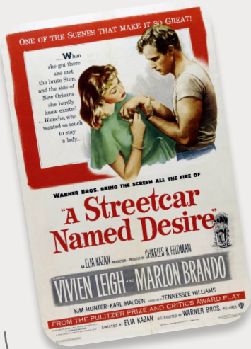
Фильм «Трамвай «Желание»

В 1914 году она стала частью военной униформы, а в 1951 превратилась в культовую вещь благодаря фильму «Трамвай «Желание» и актеру Марлону Брандо.