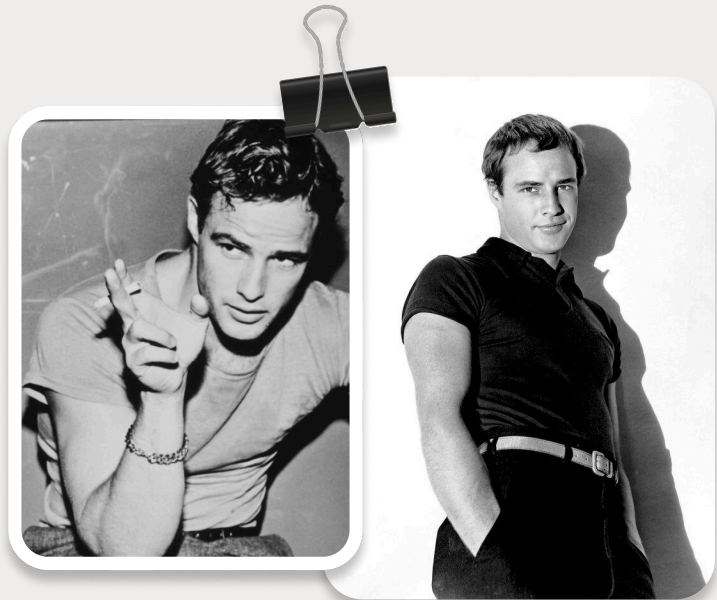
Актер Марлону Брандо