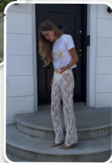
Прозрачные брюки + футболка