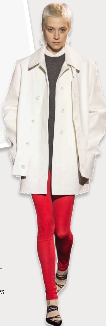
RAF SIMONS 2023