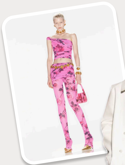
BLUMARINE RESORT 2024

Дизайнеры не отказывают себе в удовольствии поэкспериментировать с этим изделием: на показах мы можем видеть различные интерпретации - цветные леггинсы, кружевные, с фигурными штрипками, с вышивкой и аппликациями.