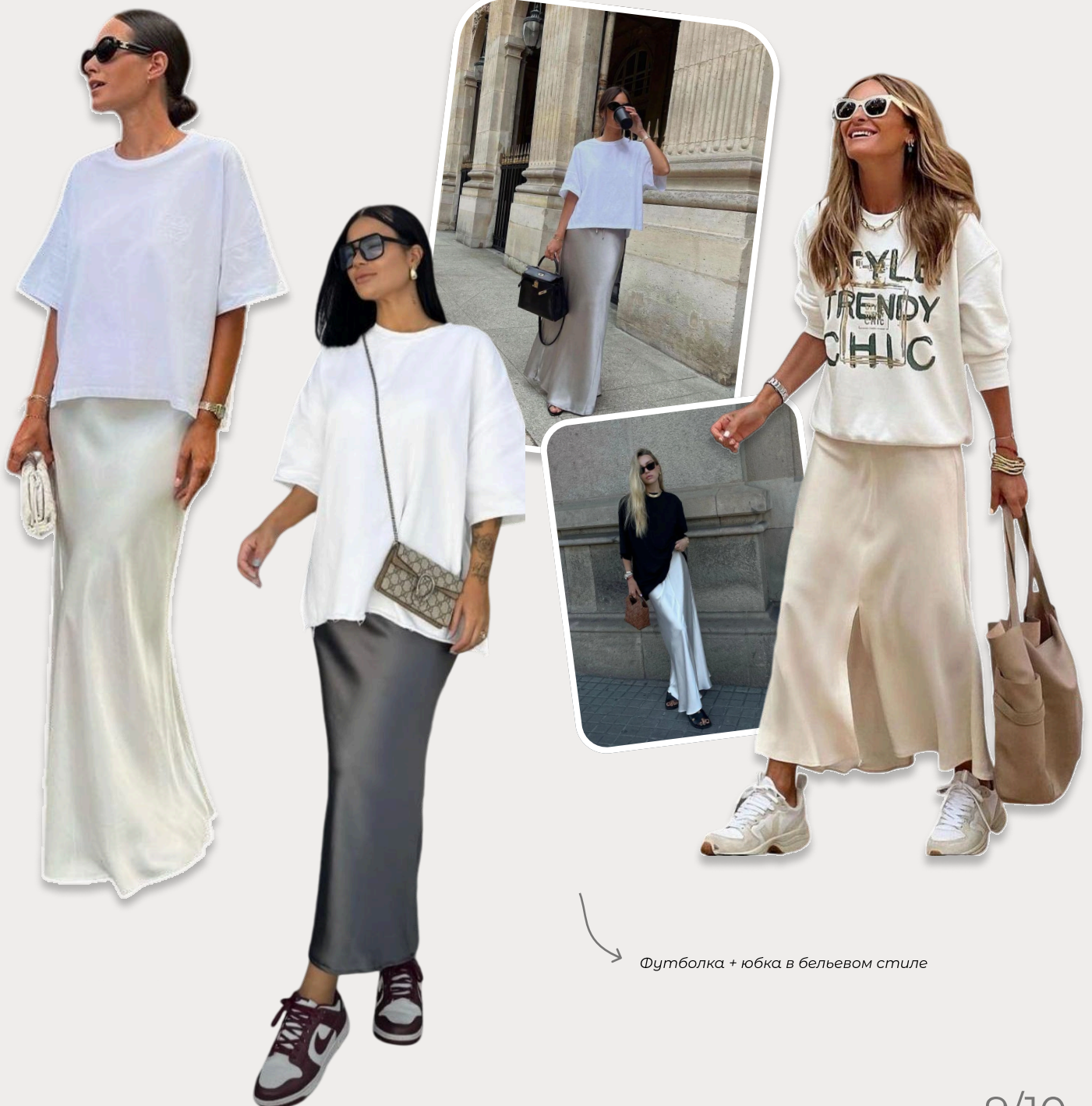
Футболка + юбка в бельевом стиле