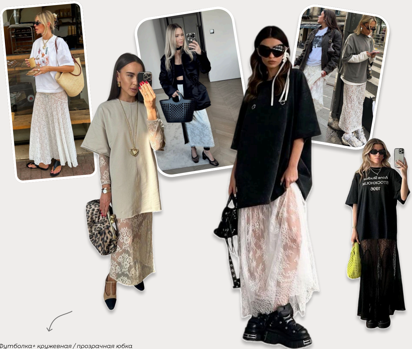
Футболка+ кружевная / прозрачная юбка