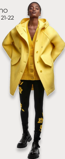
Леггинсы + джемпер / кардиган